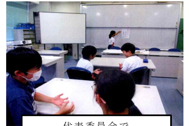
代表委員会で 運動会スローガンを決定