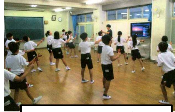
4年生「よさこい」練習中